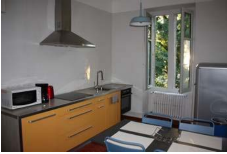
Cuisine de 12 m2 avec fenêtre côté est